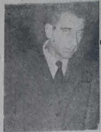
Senador don Eduardo Frei, autor de este proyecto.

derecho, es una conquista en el programa social.