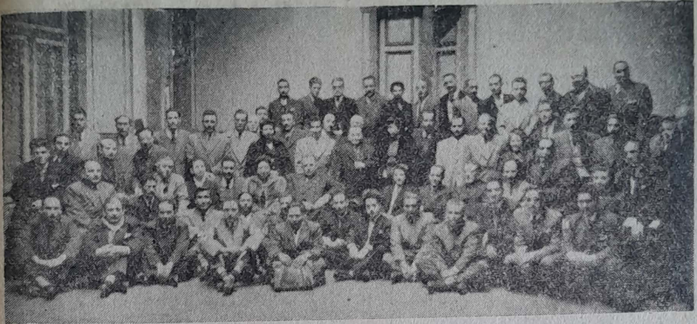
ASISTENTES A LA CONVENCION NACIONAL DEL PERSONAL DE OBRAS SANITARIAS