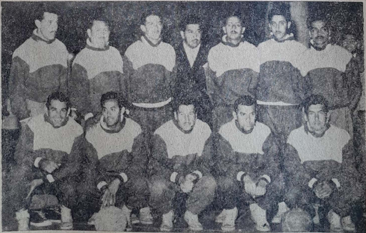
CUADRO DE SANTIAGO, QUE OBTUVO EL VICECAMPEONATO.

Tal como ocurriera en el torneo de pimpón de Valdivia, éste se vió coronado por el éxito, ya que los partidos resulta-