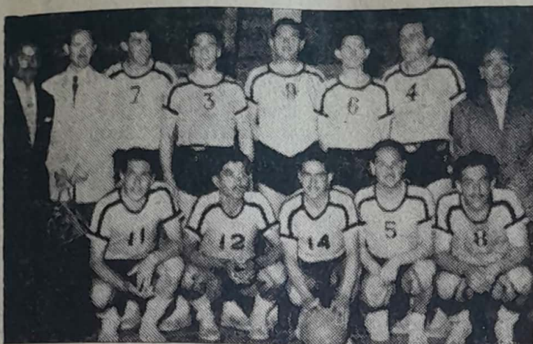
Equipo de Chillán, que se clasificó en tercer lugar.

D URANTE los días 6, 7, 8 y 9 de diciembre, se llevó a efecto en la ciudad de Valdivia, el Tercer Campeonato Nacional de Pimpon, organizado por la Asociación Deportiva de Instituciones Públicas, ADIP certamen en el que participaron equipos de Valparaíso, Talca, Chillán, Valdivia y Santiago.