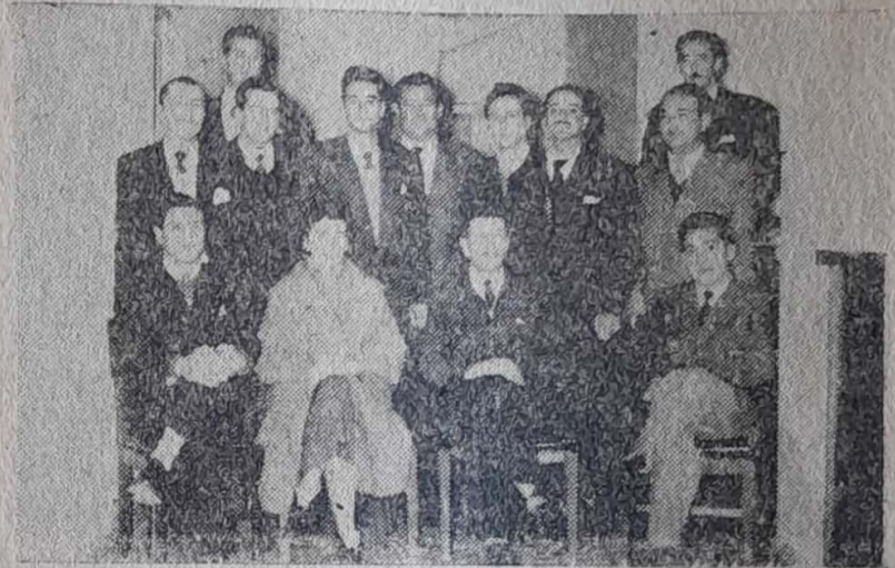
PERSONAL DE LA INSPECCION.

Comisión de Tasaciones: siete funcionarios.