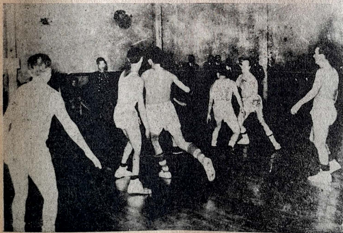
Un aspecto del match que disputaron los finalistas del torneo interno de básquetbol organizado por el Club Deportivo de la Contraloría General de la República y realizado en el Palacio de la Moneda. El partido fué ganado por el team de REGISTRO, que se impuso a Contabilidad por estrecho score: 31 — 30.